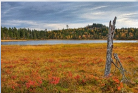
Gudbrandstjernet (597 moh) ved Kollern.

Er man først her oppe så anbefales en tur bortom både Kollernputtene - fire små tjern i det myrlendte området nord for selve toppen, og Gudbrandstjernet i sørøst.